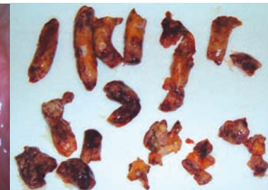
zerkleinertes entferntes Myom