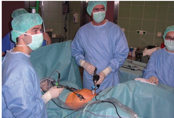
Op-Team bei Bauchspiegelung