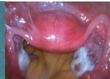
Blick ins kleine Becken: in der Mitte Gebärmutter, seitlich die Eierstöcke und Eileiter