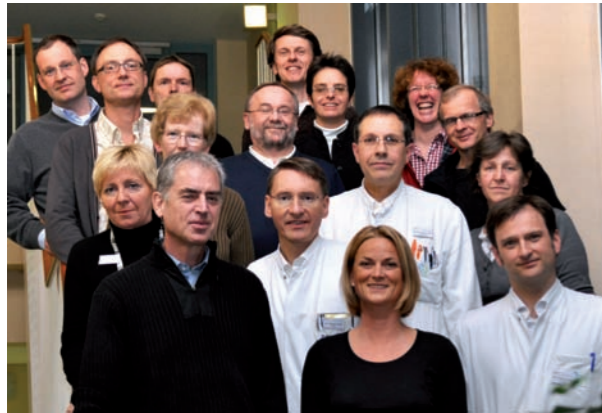
Wir sind für Sie da

Die Diagnose eines Brustkrebses löst bei vielen Betroffenen grundlegende Fragen nach der bisherigen Lebensführung und der Zukunft in Bezug auf die Krankheitsbewältigung aus. Häufig entsteht der Wunsch, diesbezügliche Fragen mit einer fachkompetenten Person auszutauschen und sich über die Möglichkeit von Selbsthilfegruppen hinaus damit auseinanderzusetzen. Wir wissen heute, dass eine positive Krankheitsbewältigung wesentlich zur Wahrung der Lebensqualität nach und während der Behandlung einer Brustkrebserkrankung beiträgt.