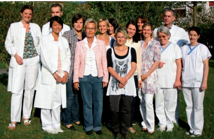
Unser Team - Wir sind für Sie da!