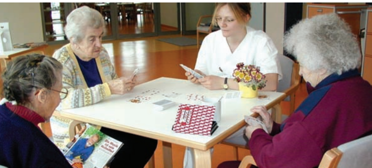
Kartenspielen ist bei Patienten und Personal beliebt! Wer wohl gewinnt?