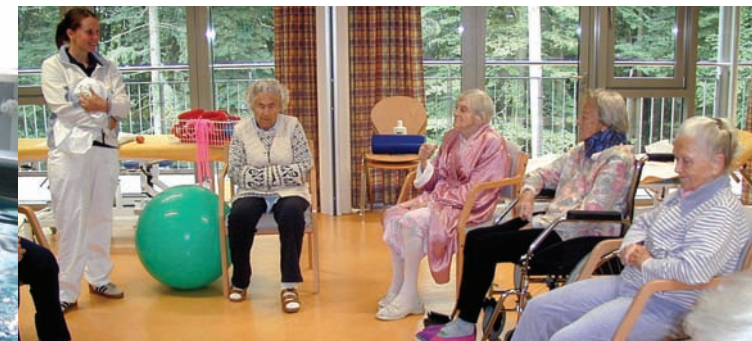
Gymnastik in der Gruppe