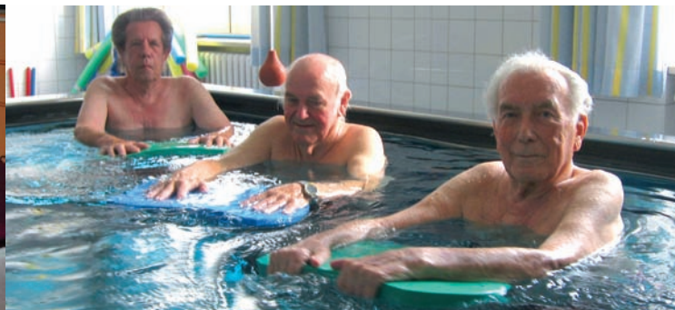
Krankengymnastik geht im "warmen" Nass gleich viel besser...