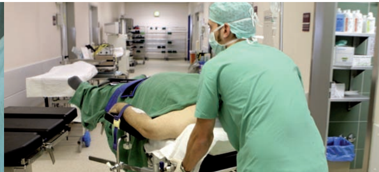
AUSBILDUNG FÜR DAS LEBEN ...