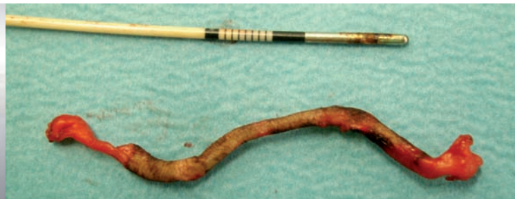
Durch die Radiofrequenzsonde (oben) "verödete" Krampfader

Ein Vollbad oder einen Saunabesuch sollte man sich frühestens ab der dritten. Woche nach der Operation vornehmen. Die direkte Sonneneinstrahlung auf das operierte Bein ist zur Verhinderung unschöner Narbenverfärbungen für mindestens zwölf Wochen zu vermeiden. Sportliche Aktivitäten können nach zwei bis vier Wochen problemlos wiederaufgenommen werden.