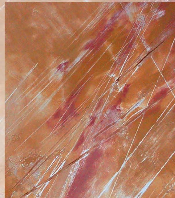
Altarwand in der Klinikkapelle

So seist du umfangen von Seinem reichen Segen.