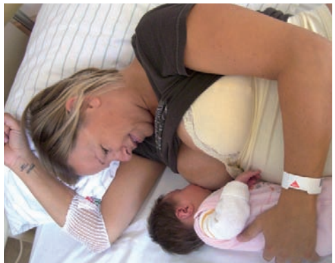
Stillen im Liegen