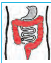
Ileostoma (Dünndarmausgang, endständig oder doppelläufig)