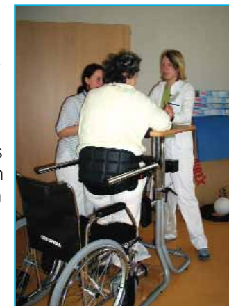
Stehtraining und Gruppentherapie in der Ergotherapie