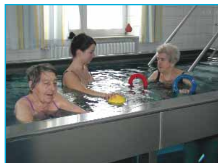
Krankengymnastik geht im "warmen" Nass gleich viel besser...