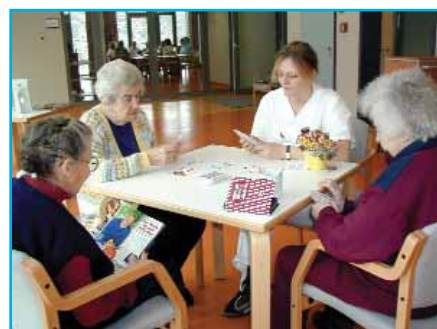
Kartenspielen ist bei Patienten und Personal beliebt! Wer wohl gewinnt?