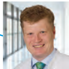
OA Dr. Joachim Leßke Gastroenterologie