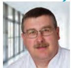
OA Dr. Ernst Mrohs Gefäßchirurgie