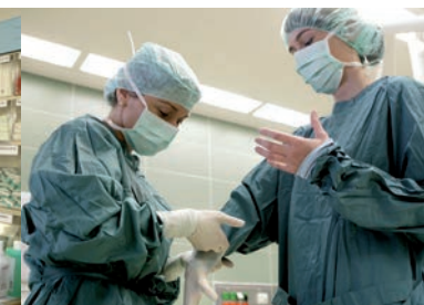
KRANKHEIT VERSTEHEN ...