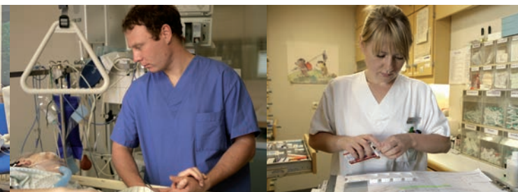
GESUNDHEIT FÖRDERN ...