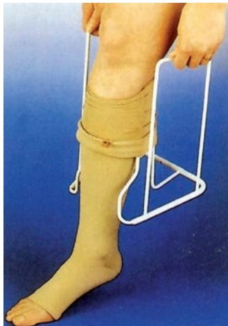
Kompressionsstrumpf mit Anziehhilfe

Die Injektion zur Thromboseprophylaxe ("Heparinspritze") sollte am Abend des Operationstages und des folgenden Tages verabreicht werden.