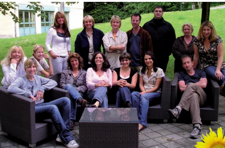
Das Pflegepersonal der Operativen Intensivstation

Bitte wenden Sie sich an das Pflegepersonal.