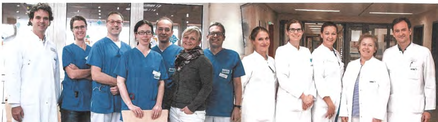
Chef- und Oberärzte der Kinder- und Frauenklinik