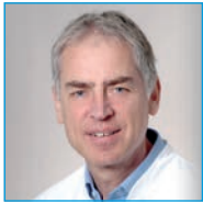
Leiter Brustzentrum Standort Bad Reichenhall