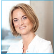
Stellvertretende Leiterin und Koordinatorin des Brustzentrums