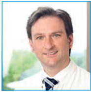
Leiter Gynäkologisches Krebszentrum und Brustzentrum