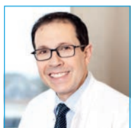
Stellvertretender Leiter des Prostatakrebszentrums und Chefarzt Strahlentherapie und Radioonkologie