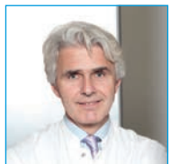
Chefarzt Urologie Niedergelassener Urologe