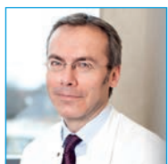
Koordinator des Prostatakrebszentrums Oberarzt Urologie Niedergelassener Urologe